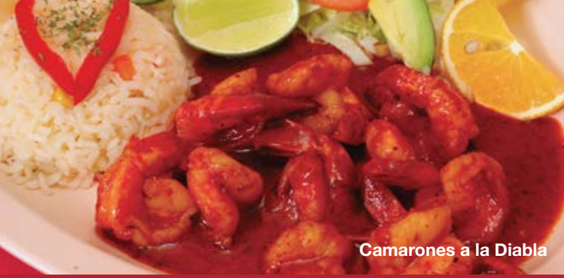
Camarones a la Diabla