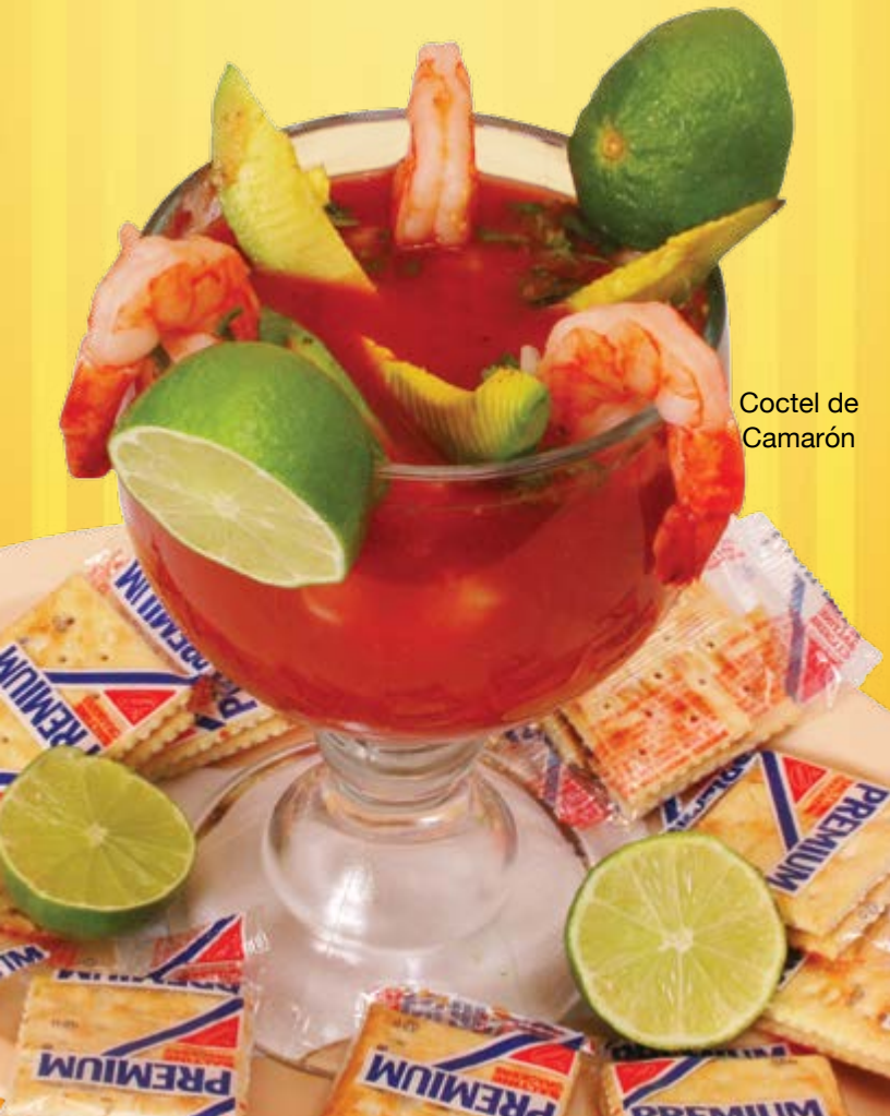
Coctel de Camarón