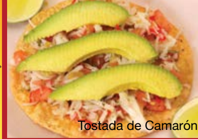
Tostada de Camarón